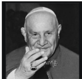
Le pape Saint- Jean XXIII